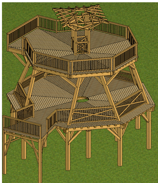
Картинка и разбор 3D © Арно Шантелу