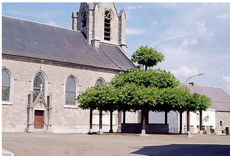
Танцевальная липа – Макон (Бельгия)

Первая липа появилась 50 миллионов лет назад.