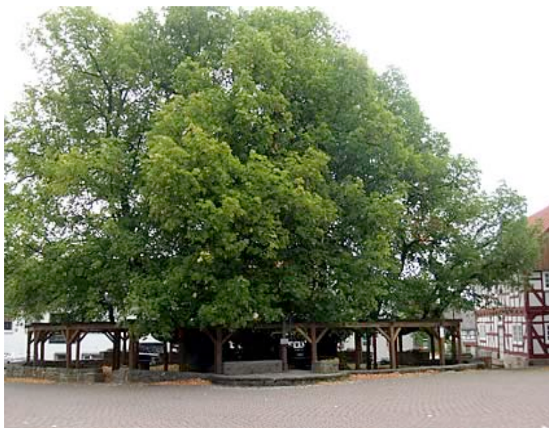
Очень старинная липа в Шенкленгсфельде (Германия)

Здесь, также, освещены три проблемные темы, представляющие важность в наше время: жизнь сельской и городской коммуны, ищущей духовной основы и развития. Плюс к тому патриотизм и сплоченность, понятие коммуны приобретаем здесь свой полный смысл по определению Фердинанда Тонни, немецкого социолога начала XX столетия, который противопоставлял понятие общества « индивидуализирующего » и индивидуальности коммуны, основанной на усилении внутренних связей 3 . Это объединяет поколения, преодолевая характерное для нашего времени расслоение общества и, как результат, одиночество человека, объединяет время и место, имея средний возраст в 1000 лет.