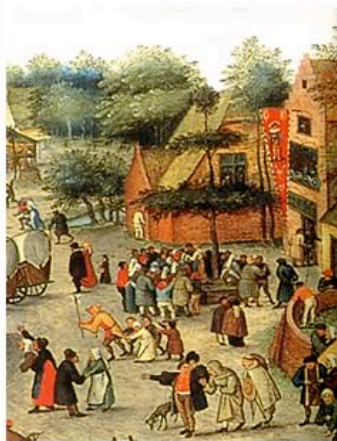
Кермес (Kermesse) с бродячим театром и процессией (фрагмент) Питер Брюгел Младший

Такого рода липа представляет собой дерево, высаженное в центре деревни или поселения, обладающее одной или более платформами, укрепленными несущей конструкцией. Использование их как танцевальной площадки берет свое начало в работе ремесленников, занимающихся веревками. Им приходилось подниматься на ветки для снятия коры дерева, и, чтобы обезопасить и облегчить работу, они укрепляли ветки, дела из них платформы. Построенные силами всех жителей, эти платформы со временем превратились в места праздничных сборов и, так зародилась традиция на них танцевать.