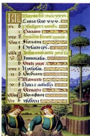
Иллюстрация из «Молитвенника Анны Бретанской»

Танцевальная липа присутствует во многих европейских обычаях. Самое древнее упоминание из нам доступных, было обнаружено в знаменитом «Молитвеннике Анны Бретанской» (датированном 1508 годом), сохранившемся в Национальной Библиотеке Франции. Образ танцевальной липы появляется также в творчестве фламандских художников Питера Брюгеля Старшего и Питера Брюгеля Младшего, равно как у Лукаса Тофля. Известный французский фольклорист и этнолог, Арнольд ван Геннеп, пишет о том, что в Ланде, коммуна на севере Франции, еще в конце XIX века была обнаружена старинное танцевальная липа с двойной кроной и укрепленными (подпертыми) ветками, образующими подобие платформы вокруг ствола. Лишь несколько подобных и очень старинных танцевальных лип еще сохранились в некоторых областях Германии, Бельгии и Голландии.