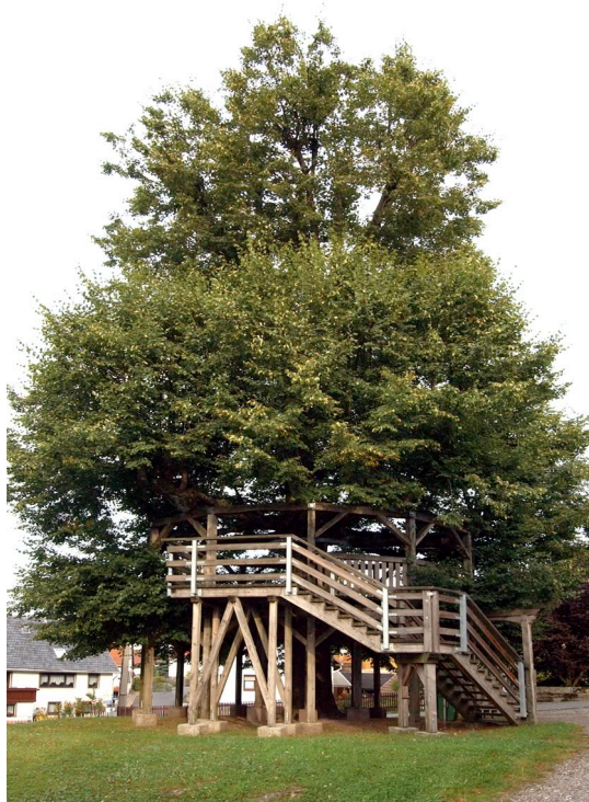
Липа в Эффельдер (Германия)

Этот цикл символизирует существование рождения и возрождения. Солнце рождается а зимнее солнцестояние, поднимается в Сретение, проходит весеннее равноденствие в летнее солнцестояние, время роста семя от зарождения до жатвы, начало августа, далее убывает с ноября до зимнего солнцестояния чтобы возродиться. Это дерево, будто мостик между небом, человеком и землей, позволит нам познакомиться с законами и закономерностями извечных циклов и почувствовать себя частью Вселенной.